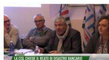
19-12-2017 La Cisl chiede il reato di disastro bancario