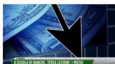
29-11-2017 A scuola di banche, 3a lezione: i mutui