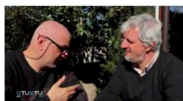
17-11-2017 A Tu Per Tu: A scuola di banche: l'educazione ...