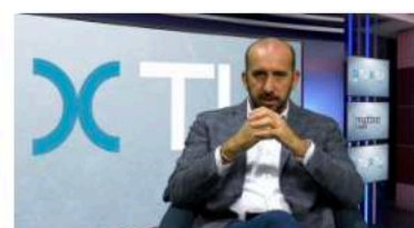
17-11-2017 A Tu Per Tu: A scuola di banche: gli strumenti di ...