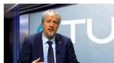
17-11-2017 A Tu Per Tu: A scuola di banche: il conto corrente