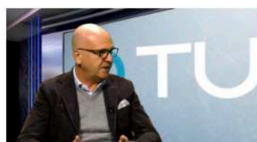
17-11-2017 A Tu Per Tu: A scuola di banche: i mutui