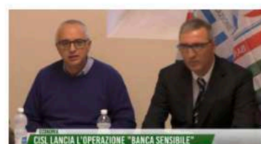
31-01-2018 CISL lancia l'operazione "banca sensibile"