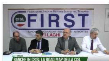
29-01-2016 Banche in crisi, la road map della Cisl