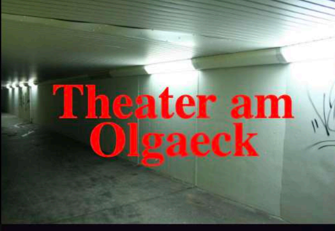
Theater am Olgaek