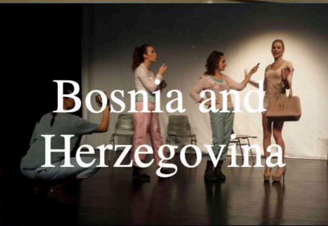
Bosnia and Herzegovina