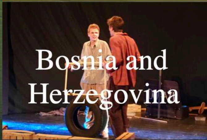
Bosnia and Herzegovina