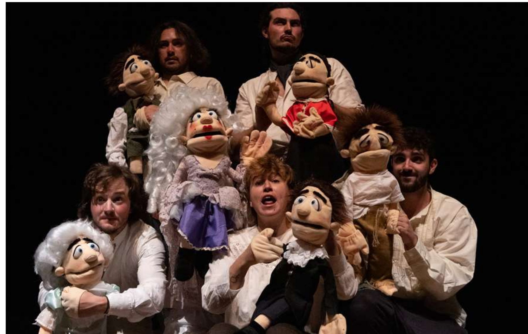
Escena de '1789' de la companyia navarresa Teatro en la Chácena

La vint-i-quatre edició del Festival Internacional de Teatre Amateur de Girona (FITAG) tindrà lloc del 27 al 31 d'agost i reunirà una vintena de companyies de procedències diverses. Indrets singulars gironins, com l'auditori Viader, el pati de la Casa de Cultura de la Diputació de Girona, el Centre Cultural La Mercè o el Pati de les Magnòlies de la seu del Govern de la Generalitat a Girona, acolliran agrupacions vingudes des de tots els recons de l'estat i més enllà. Hi destaca la participació d'una companyia italiana provinent de L'Alguer que representarà el que es considera el primer monòleg en alguerès de la història del teatre català: Un amor de monja , creat l'any 2022 per Elisabetta Dettori i Massimiliano Fois . La presència internacional es completarà amb grups provinents d'altres ciutats d'Itàlia, Ucraïna, Marroc, Algèria i Polònia.