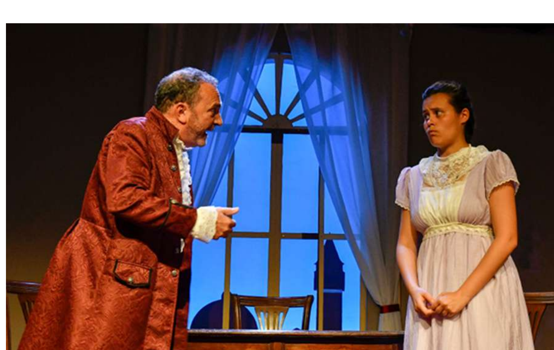
El Grup de Teatre La Palma celebrarà el seu centenari amb la representació de 'Els rústecs' de Carlo Goldoni

El FITAG també donarà veu al drama dels refugiats i els naufragis del Mediterrani amb l'obra Gli altri , de la companyia italiana QU.EM. Quintelemento , especialitzada en combinar el llenguatge escènic amb l'audiovisual, i abordarà temes d'actualitat com la salut mental, amb l'obra La estela de Estela , de la companyia madrilenya Vocingleando , o els abusos de poder en l'àmbit formatiu amb la companyia valenciana Luna Plena Teatre –impulsora de la Mostra Internacional de Mim de Sueca– i la seva proposta Una carretera sense arbres .